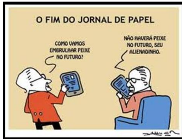
Figura 3: Efeitos da globalização