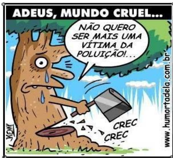
Figura 1: Poluição da natureza